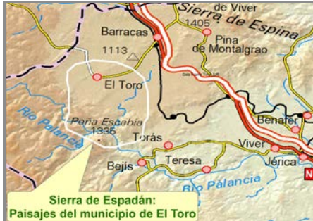
Sierra de Espadán: Paisajes del municipio de El Toro